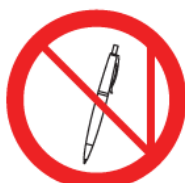
Pen / Button hole Cameras