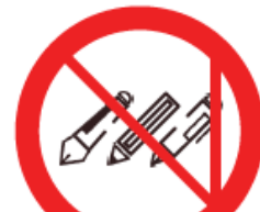
Pens or Pencils