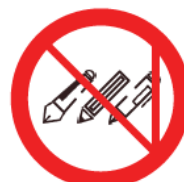
Pens or Pencils